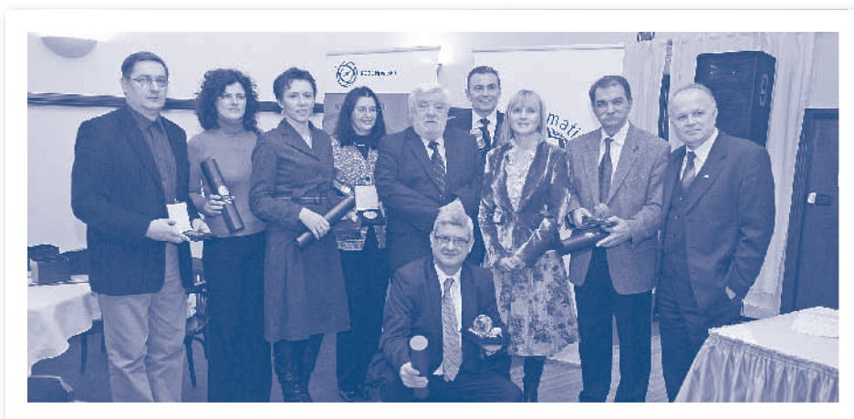
Slika 2.29. Dobitnici priznanja HIZ-a u 2007. godini

U poglavlju 9.1. nalazi se popis dosadašnjih članica HIZ-a zainteresiranih za poslove od zajedničkog interesa ili krovne poslove, dok je popis članica udruga i foruma naveden u poglavlju udruga ili foruma ili u privitku 9.2.