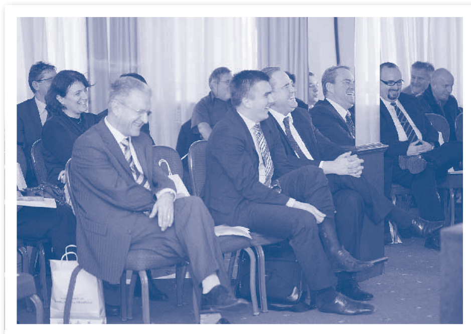
Slika 2.20. Vesela atmosfera na skupštini HIZ-a, Zagreb 2011.

Pojavom financijske krize, naročito 2010. i 2011. godine, HIZ je pokrenuo više aktivnosti s ciljem realizacije programa rada i poslovanja, naročito senzibilizacije članica i drugih za edukaciju i certifikaciju korisnika osobnih računala i IT profesionalaca, koje su rezultirale porastom ukupnog prihoda u 2011. godini u odnosu na godinu prije.