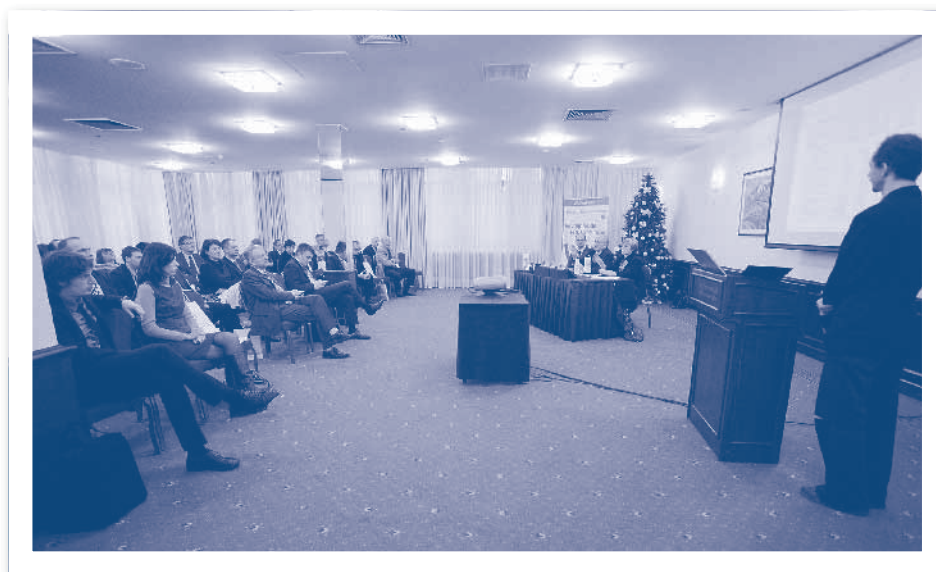
Slika 2.1. Svečana godišnja skupština HIZ-a, Zagreb 2011.

U HIZ-u djeluje više od 200 pravnih osoba te više od tisuću pojedinaca.