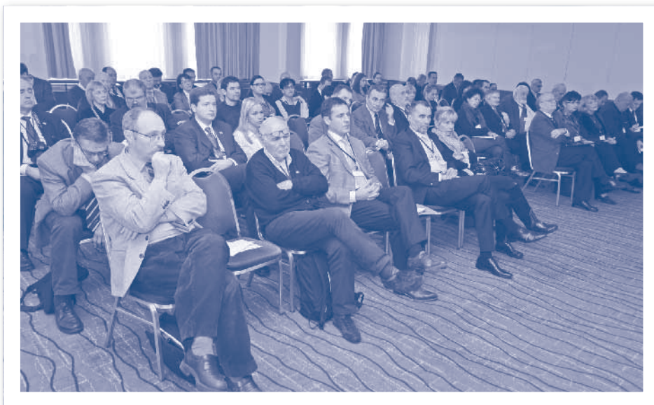
Slika 2.23. Međunarodna konferencija o e-poslovanju, Zagreb 2010.

Nakladničku djelatnost HIZ-a činilo je: publiciranje biltena Informatika, časopisa Informatika, knjiga i zbornika radova sa savjetovanja, kao i biltena strukovnih udruga. Do danas HIZ je izdao više od 100 biltena Informatika, a bio je i nakladnik prvog hrvatskog časopisa Informatika koji se pojavio 1975. i izašao u 45 brojeva. Naklada prvog broja bila je svega 200 primjeraka. U 14 godina izlazenja ovog časopisa to je bio jedini prozor u informatički svijet tiskan na hrvatskome jeziku.