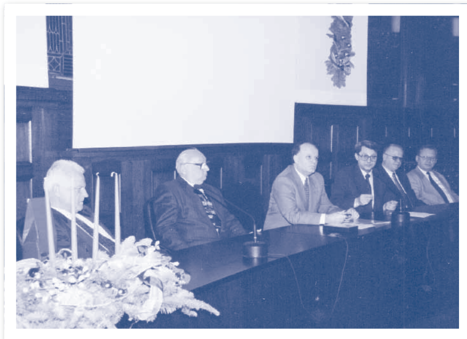
Slika 2.12. Svečana skupština HIZ-a povodom 20. godišnjice rada, 1996.

Tom prigodom dodijeljena su Posebna priznanja pojedincima i organizacijama koji su dali svoj doprinos razvoju hrvatske informatike i Zajednice u proteklih 20 godina.