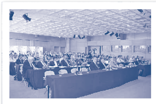
Slika 2.3. Svjetski ECDL Forum, Dubrovnik 2006.

Konferenciji su prisustvovali i predsjednik CEPIS-a Niko Schlamberger te direktor ECDL Fondacije Damien O'Sullivan. Nakon uspješne konferencije iduće su održane na Bledu, Beogradu, Sarajevu i Prištini.