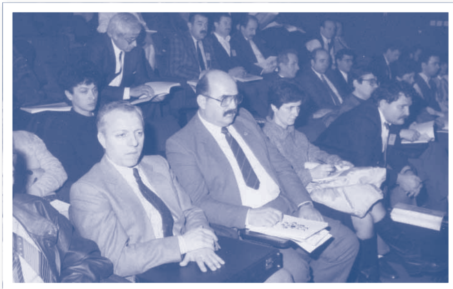
Slika 2.6. Skupština HIZ-a, Opatija 1976.

Izabran je Koordinacijski odbor Privremene zajednice u sljedećem sastavu: