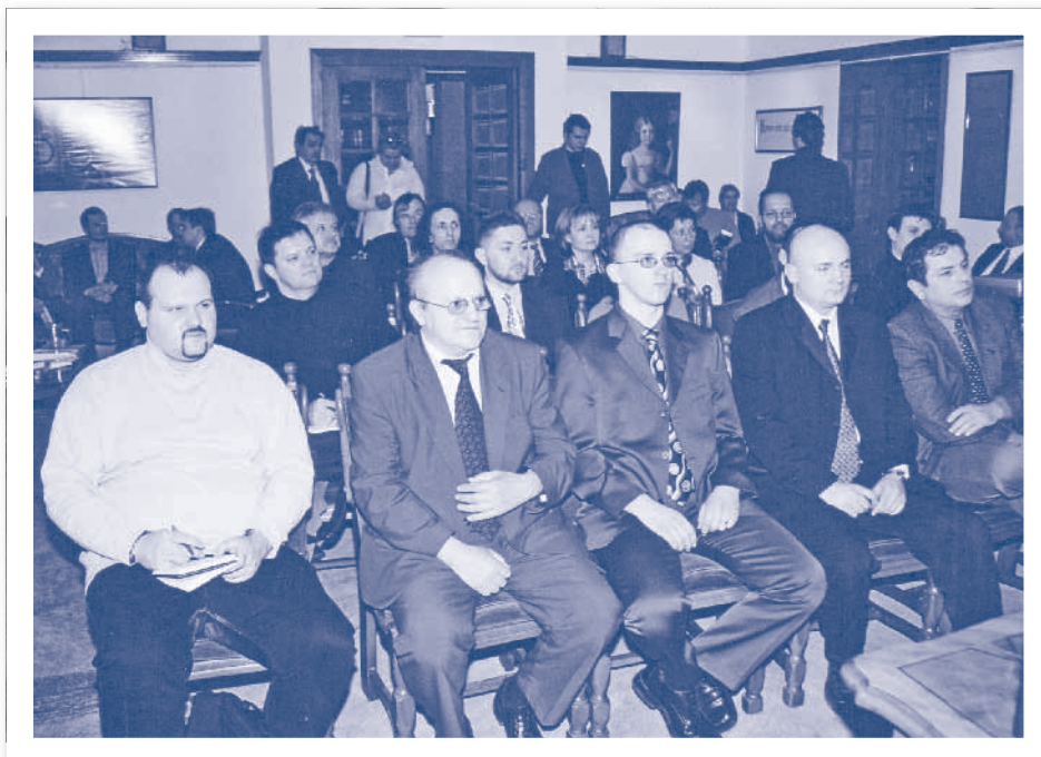
Slika 2.18. Skupština HIZ-a, Zagreb 2006.