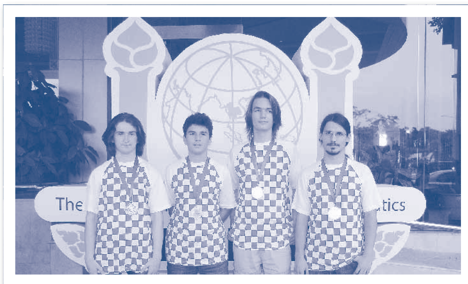
Slika 2.2. Dobitnici medalja na Međunarodnoj informatičkoj olimpijadi, Tajland 2011.

U HSIN djeluje više od tisuću mladih, od kojih najbolji uspješno sudjeluju na državnim, regionalnim, europskim i svjetskim informatičkim olimpijadama mladih na kojima su osvojili više od 100 medalja.