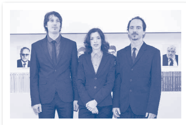
Slika 2.28. Zaposlenici stručne službe HIZ-a