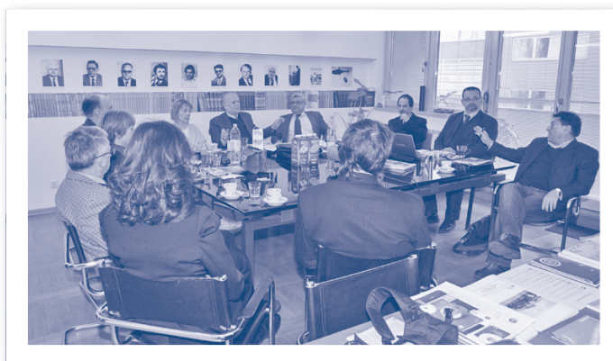
Slika 2.27. Sjednica Upravnog odbora HIZ-a, Zagreb 2011.

Sjednice Upravnog odbora održavaju se prema potrebi, a pravovaljane odluke donose se većinom glasova svih članova. Članovi koji nisu prisutni mogu se izjašnjavati o točkama dnevnoga reda pisanim putem.