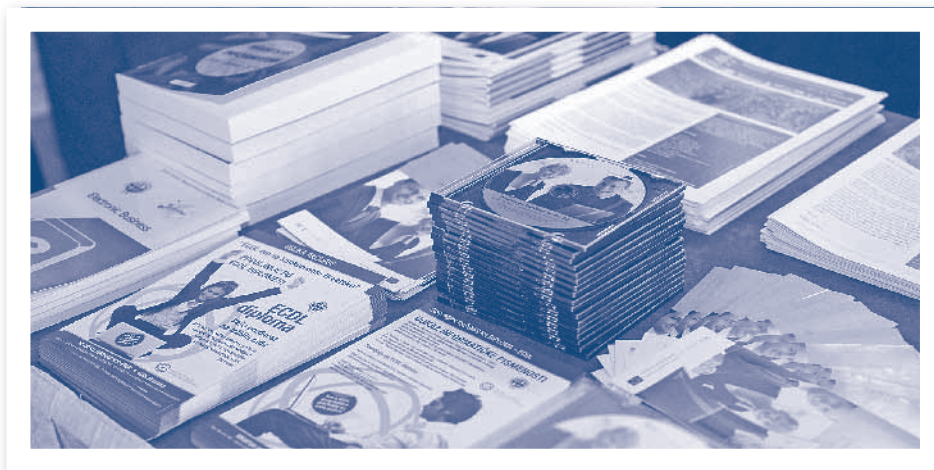
Slika 2.24. Izdanja HIZ-a