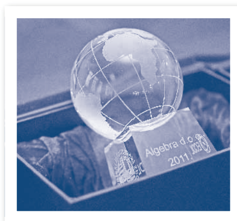
Slika 2.25. Slika kristalnog globusa HIZ-a

Kristalni globus dodjeljuje se pojedincima i organizacijama za naročite zasluge u međunarodnoj suradnji HIZ-a s regionalnim, europskim i svjetskim IT asocijacijama te doprinosa u uvođenju i primjeni europskih i svjetskih normi u IT.