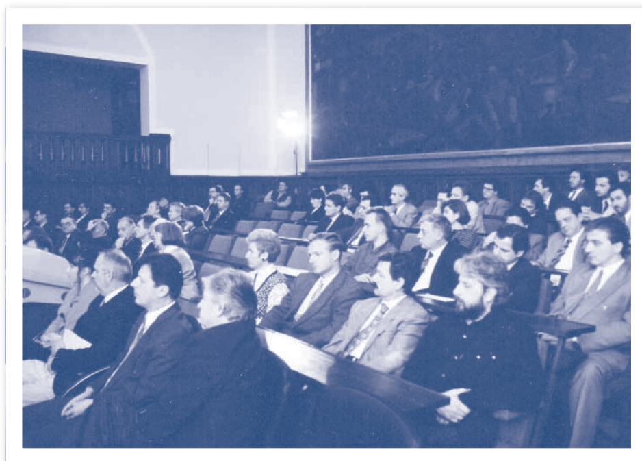
Slika 2.13. Skupština HIZ-a povodom 20. godišnjice HIZ-a, 1996.