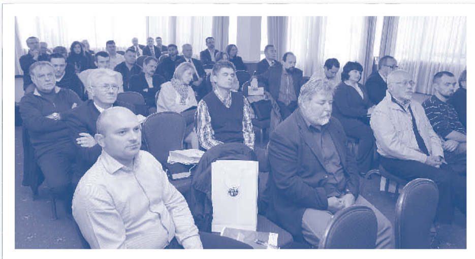
Slika 2.19. Skupština HIZ-a, Zagreb 2011.